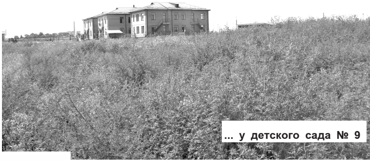
... у детского сада № 9