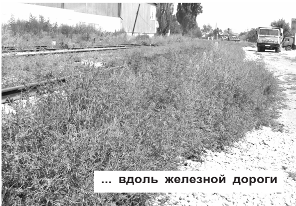
... вдоль железной дороги

тинного сорняка еще тогда, когда это можно было сделать?