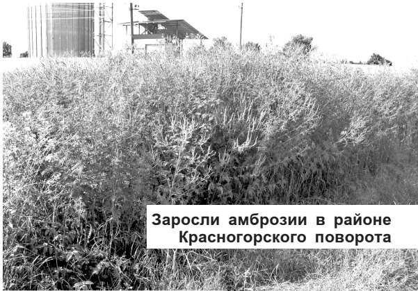
Заросли амброзии в районе Красногорского поворота

мне по-настоящему стало плохо. И первой мыслью было: что теперь делать с этим вредителем? Ведь с амброзией бороться трудно вообще, а когда она вымахала в такой рост... Я понимаю, что садик – на окраине, можно сказать, в поле. Но ведь у этого пустыря есть хозяин, все знают, что в Ардоне бесхозных земель уже не осталось. Почему руководители садика, родители детей не били в колокола и не требовали от чиновников, чтобы нашли того, кто должен был предпринять меры по уничтожению каран-